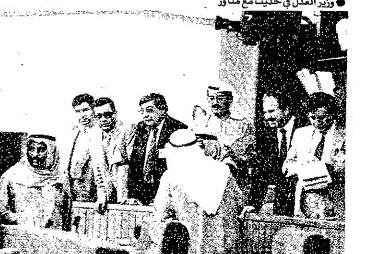
الصحافيون بعد رفع الجلسة في حديث مع النواب